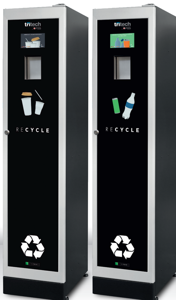
TRITURATORE BICCHIERI TRITECH TOWER TOUCH Capacità: n.1.700 bicchieri Cod. 987025MMAA031