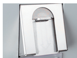
Inserimento monete antivandalico