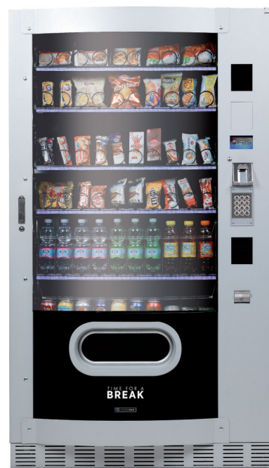
Skudo Max GCD 1050