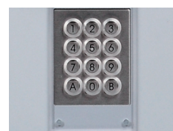
Tastiera illuminata protetta da lexan 5 mm