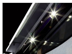
Illuminazione interna con Power LED laterali e superiori