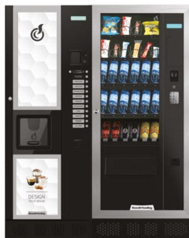
LEI400 + ARIA M MASTER

LEI400, distributore automatico per bevande calde con capacità di 400 bicchieri.